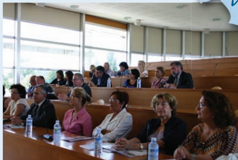
Rencontre sur le thème de la formation professionnelle à la Chambre de Commerce et d'Industrie de Nord Isère