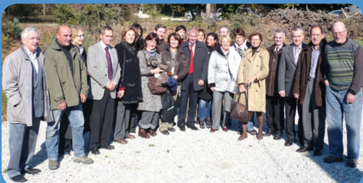
Les Conseillers Régionaux du Groupe UMP et apparentés à la rencontre des producteurs de la Drôme

Dans cet objectif à atteindre, notre Groupe uni et 1 ère force d'opposition, apportera sa contribution et sa détermination afin qu'ensemble nous fassions gagner Rhône-Alpes !