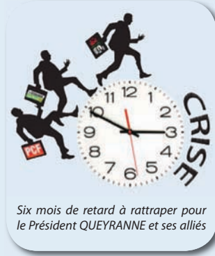
Six mois de retard à rattraper pour le Président QUEYRANNE et ses alliés

Un Etat qui, lui, a su faire face à la crise dès octobre 2008.